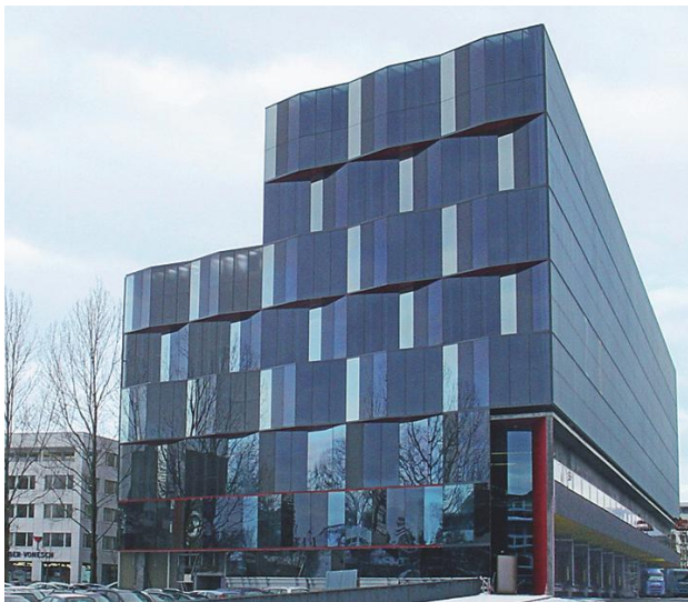
Abb. 4: Das moderne Logistik-Center «ZUGgate» von V-ZUG

Die moderne Lagerverwaltung LASOFT ermöglicht im Weiteren eine komfortable Visualisierung sämtlicher Abläufe und stellt eine detaillierte Verwaltung der Seriennummern sicher. Damit kann bei V-ZUG jedes Produkt bis zum Kunden nachverfolgt werden, was der Qualitätskontrolle zugutekommt. V-ZUG ist für eine Zukunft mit weiterhin rasant ansteigendem Auftragsvolumen bestens gerüstet!